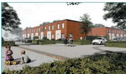
Projectbouw van MooiZEN

Begin 2020 volgt de laatste projectbouw in Spijkvoorderenk. Op de braakliggende grond langs de Johannes Broekhuijsenstraat worden 13 unieke woningen gebouwd volgens het MooiZEN-concept. Het gaat om energiezuinige woningen waarbij zoveel mogelijk gebruikgemaakt wordt van circulaire en biobased materialen. De bouw gaat supersnel: het casco